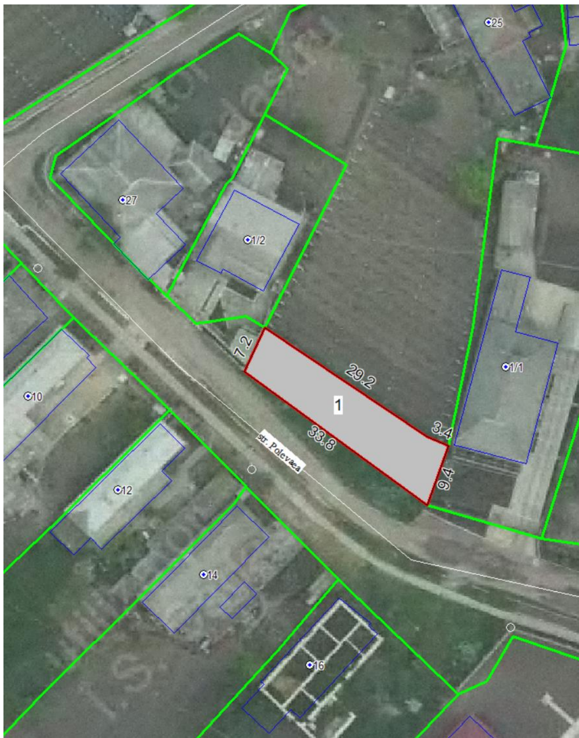
Схема отвода участка для благоустройства по ул. Полевая.